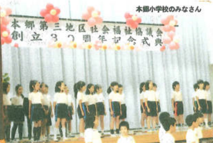
本郷小学校のみなさん

この30周年記念を期して、これからもより一層の福祉活動の充実に力を入れていきたいと思いをいたしました。