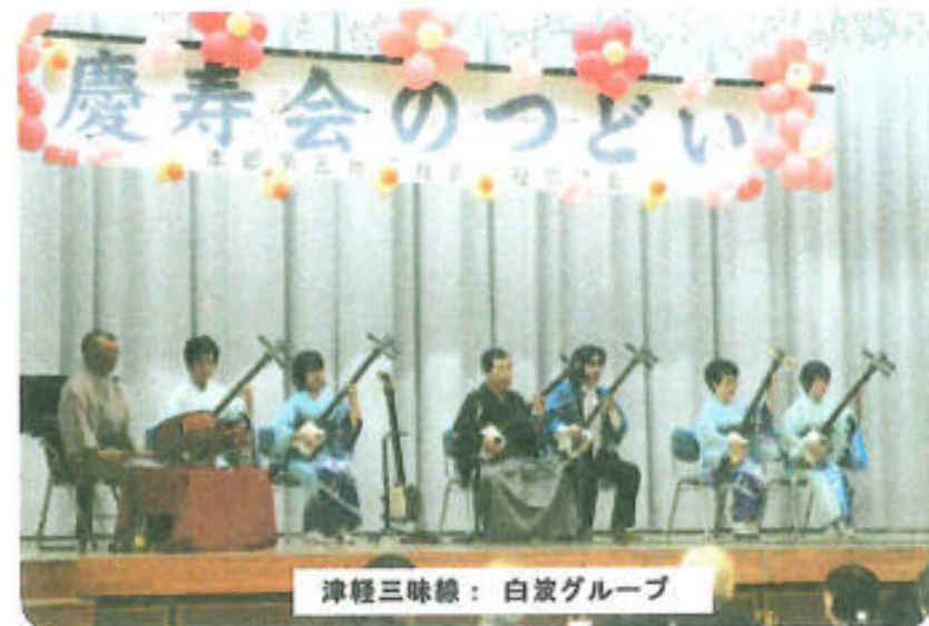
津軽三味線：白波グループ