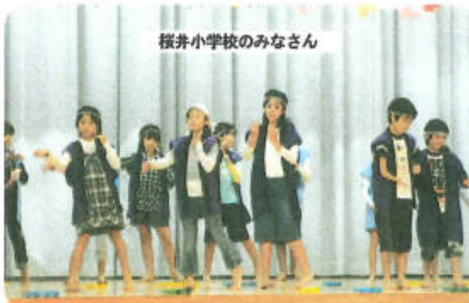
桜井小学校のみなさん