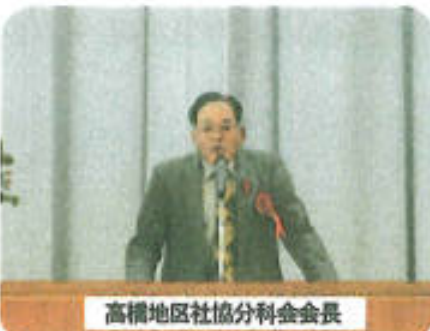
高橋地区社協分科会会長