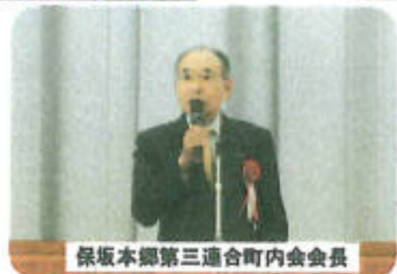
保坂本郷第三連合町内会会長