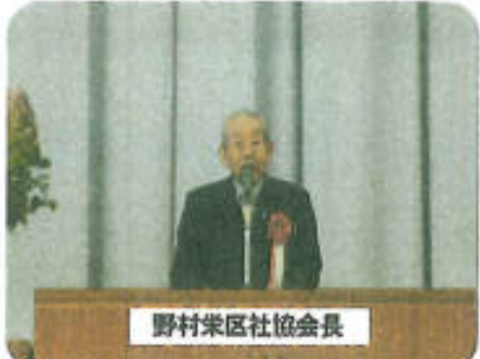
野村栄区社協会長