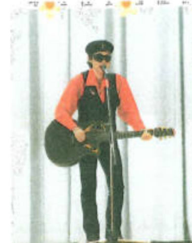
ギター漫談：あさひのぼる