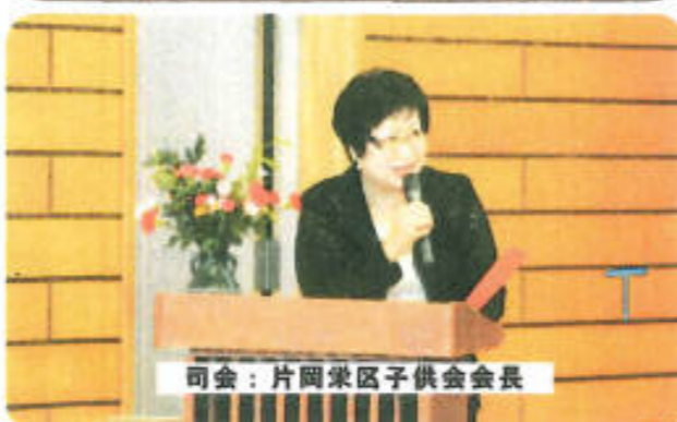
司会：片岡栄区子供会会長