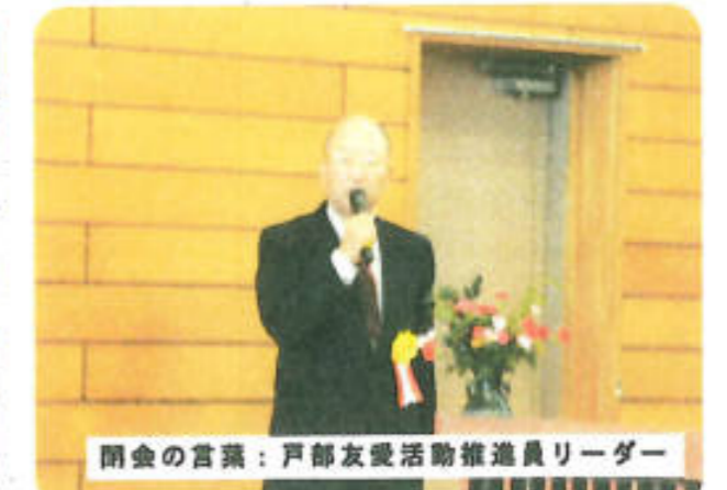
閉会の言葉：戸部友愛活動推進員リーダー