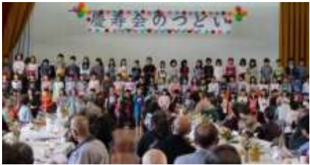
本郷小学校の3年生のみなさん