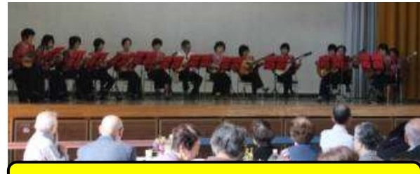
マンドリン演奏 アンサンブル・パストラーレ