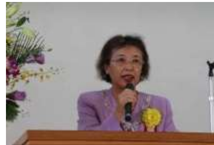
開会挨拶 村田地区社会福祉協議会会長

10月27日(日)、本郷小学校体育館において「第11回 慶寿会」が開催されました。本郷小学校のみなさんの歌と踊りや日舞、マンドリン演奏などを参加者全員が楽しみました。おいしいお弁当をいただいたあとは、ことぶき体操とジャグリング、マジックで一層盛り上がりました。参加の皆様から「また来年も来たいと思います！」という声が寄せられました。