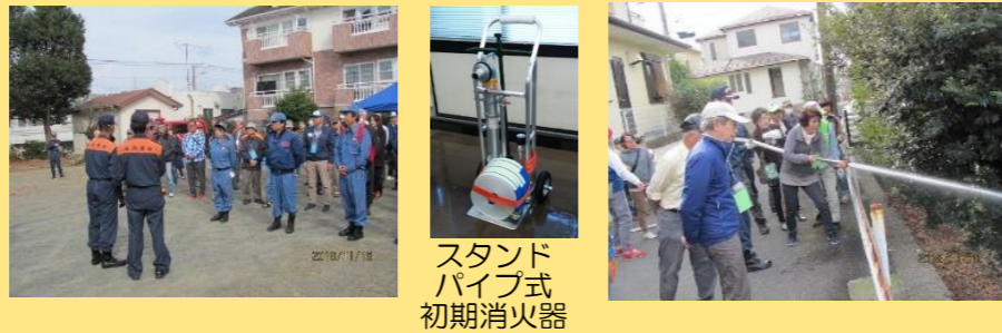
スタンドパイプ式初期消火器

高齢化の進む若竹町だからこそ、万一来に備えより多くの方の参加を今後も促していきたいと思えます。