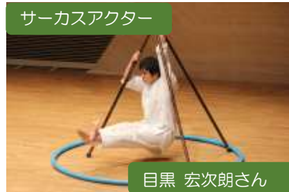
サーカスアクター