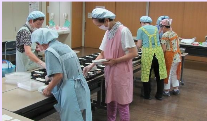
調理担当活動風景