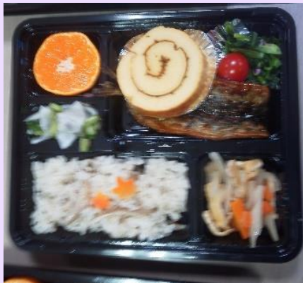
家庭の味のお弁当

調理ボランティア(約40名)配達ボランティア(約25名)は原則月に1回、都合の良い週に参加していただいております。