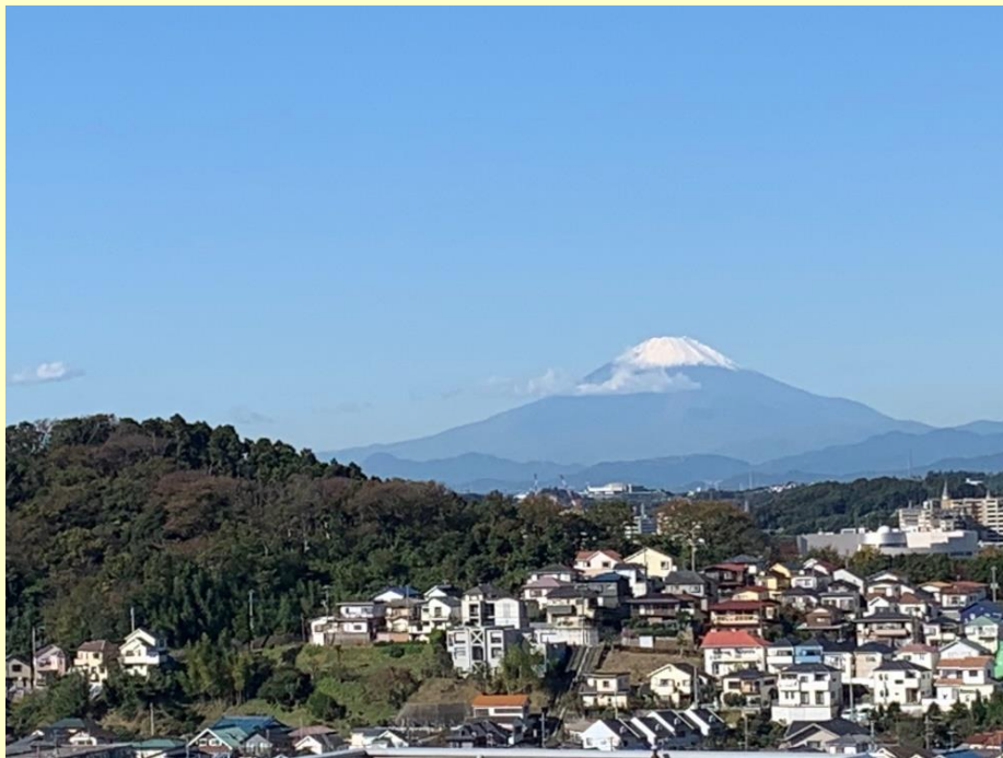
町内からの眺望 ふじやま公園（手前の丘）と富士山